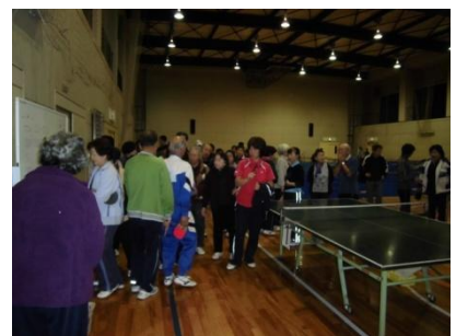
本当にありがとうございました！