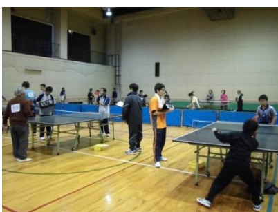
小学生も参加しました♪