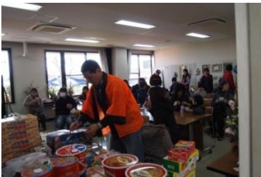
なぜかビンゴ大会も！