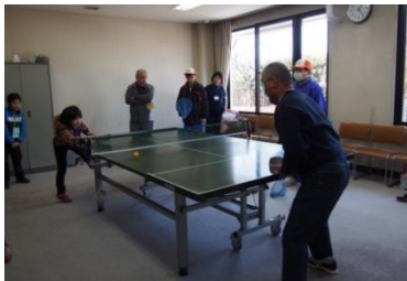
サウンドテーブルテニス