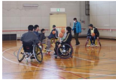
車椅子バスケットボール