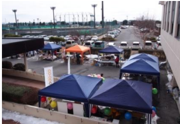
外も賑わいました♪