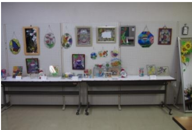
素敵な展示コーナーも