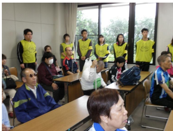
たくさんの選手が参加されました