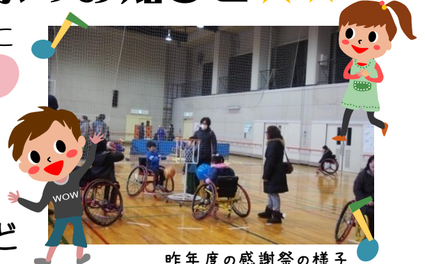
昨年度の感謝祭の様子