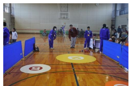
コントロールアタック