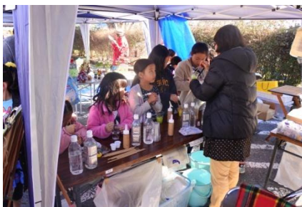
スライム作ってみよう!