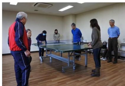
サウンドテーブルテニス