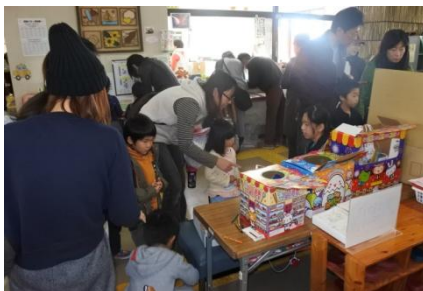
くじひきワイワイ