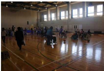
車いすバスケットボール