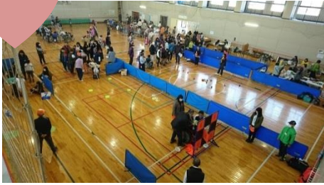
体育館では5つのスポーツを体験！