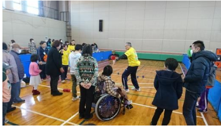
ボッチャコーナー