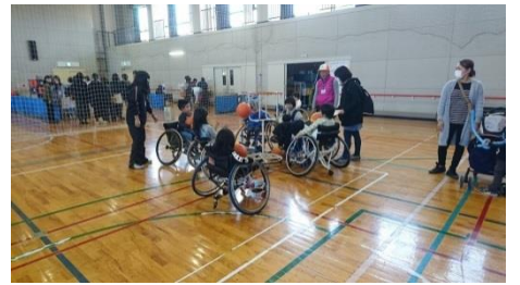
車椅子バスケットボール