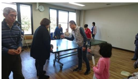
サウンドテーブルテニス