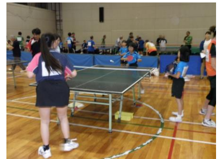
年齢関係なく試合!