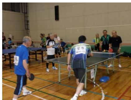
ダブルスも盛り上がる!