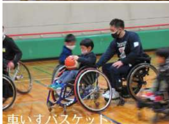
車いすバスケット