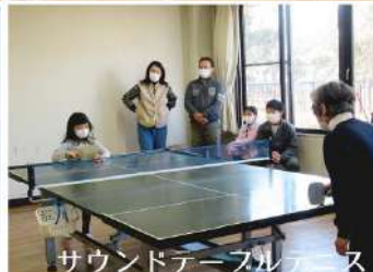
サウンドアースレスニス